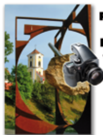
FOTO LANGHANS FÜRSTENFELD HAUPTSTRASSE 9

Filiale Fachmarktzentrum Fürstenfeld Filiale Fachmarktzentrum Jennersdorf