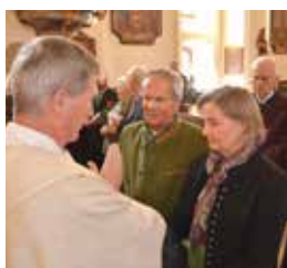
Erinnerungen an viele gemeinsame Jahre