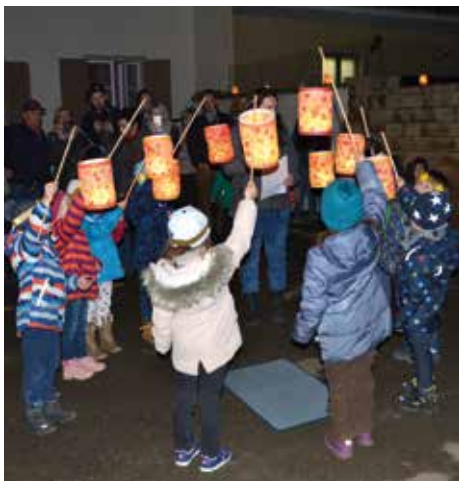
Das Laternenfest zu Ehren des hl. Martin und der Bischof im Pfarrkindergarten.