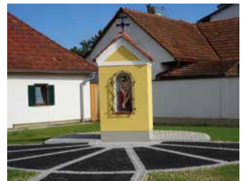
Ein historisches Bild: Der alte und im Hintergrund der neugestaltete Bildstock mit großzügigem Vorplatz abseits der stark frequentierten Kreuzung nach Söchau.